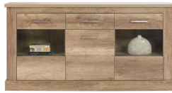
BR 3 - kredens szer./gł./wys. 174,5/40/89