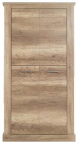
BR 7 - szafa 2D szer./gł./wys. 104,5/53,5/201