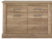
BR 2 - komoda szer./gł./wys. 124,5/40/89