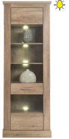
BR 5 - witryna L/P szer./gł./wys. 72/40/201