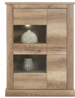
BR 4 - witryna szer./gł./wys. 104,5/40/141,5