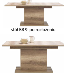
stół BR 9 po rozłożeniu